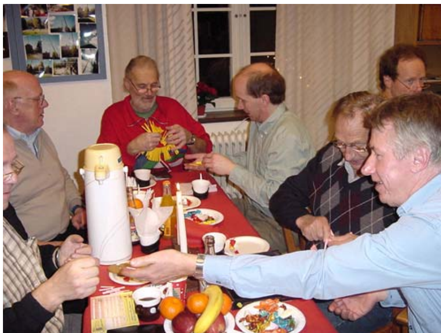
Lotteriförsäljning på Lilla Julafton