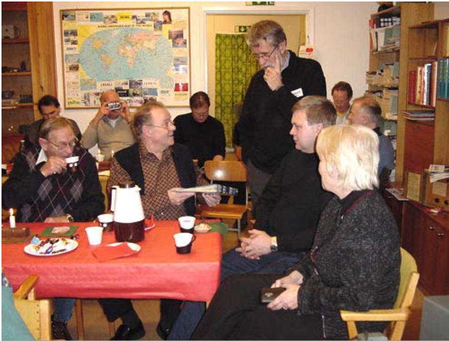
Efter SMØAGD/Eriks föredrag blev det en hel del diskussioner runt de olika borden.